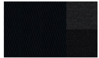
Тканевая обивка сидений "CHILICO" (9GFY)