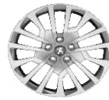
Колпаки штампованных стальных дисков 16" MIAMI