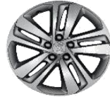
Литые алюминиевые диски 17" CURVRE